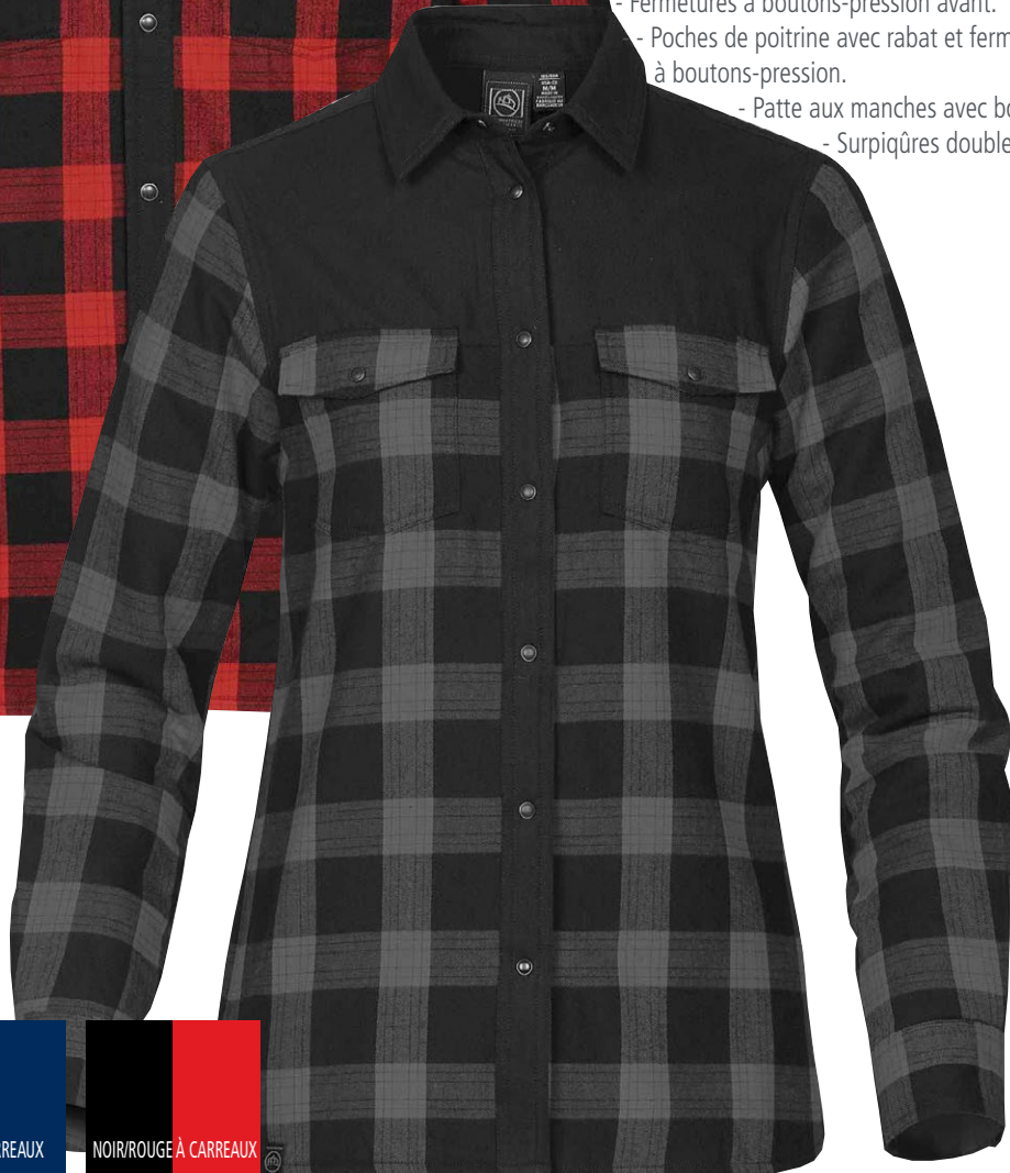
Chemise pour femmes en carbone à carreaux