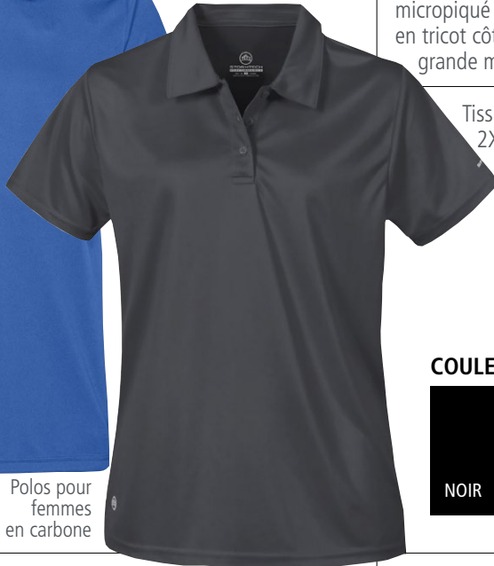
Polos pour femmes en carbone