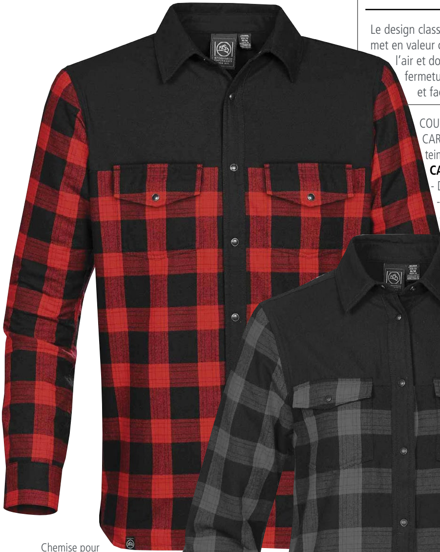
Chemise pour hommes en noir/rouge à carreaux