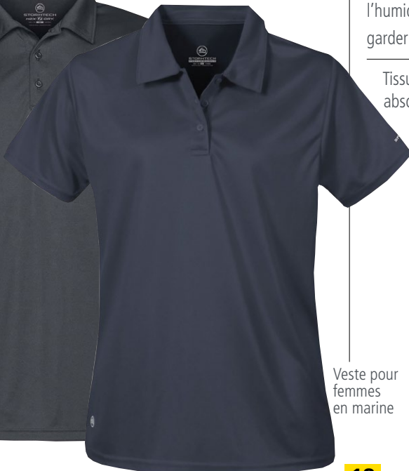
Veste pour femmes en marine