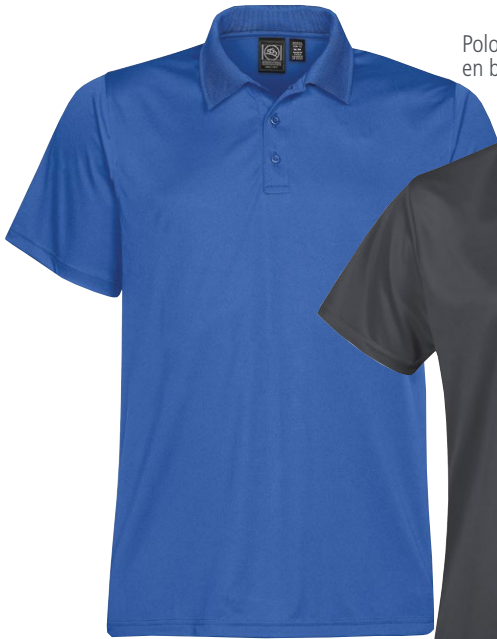
Polo pour hommes en bleu azur

(P à 5TG en noir, marine, carbone, pour hommes)