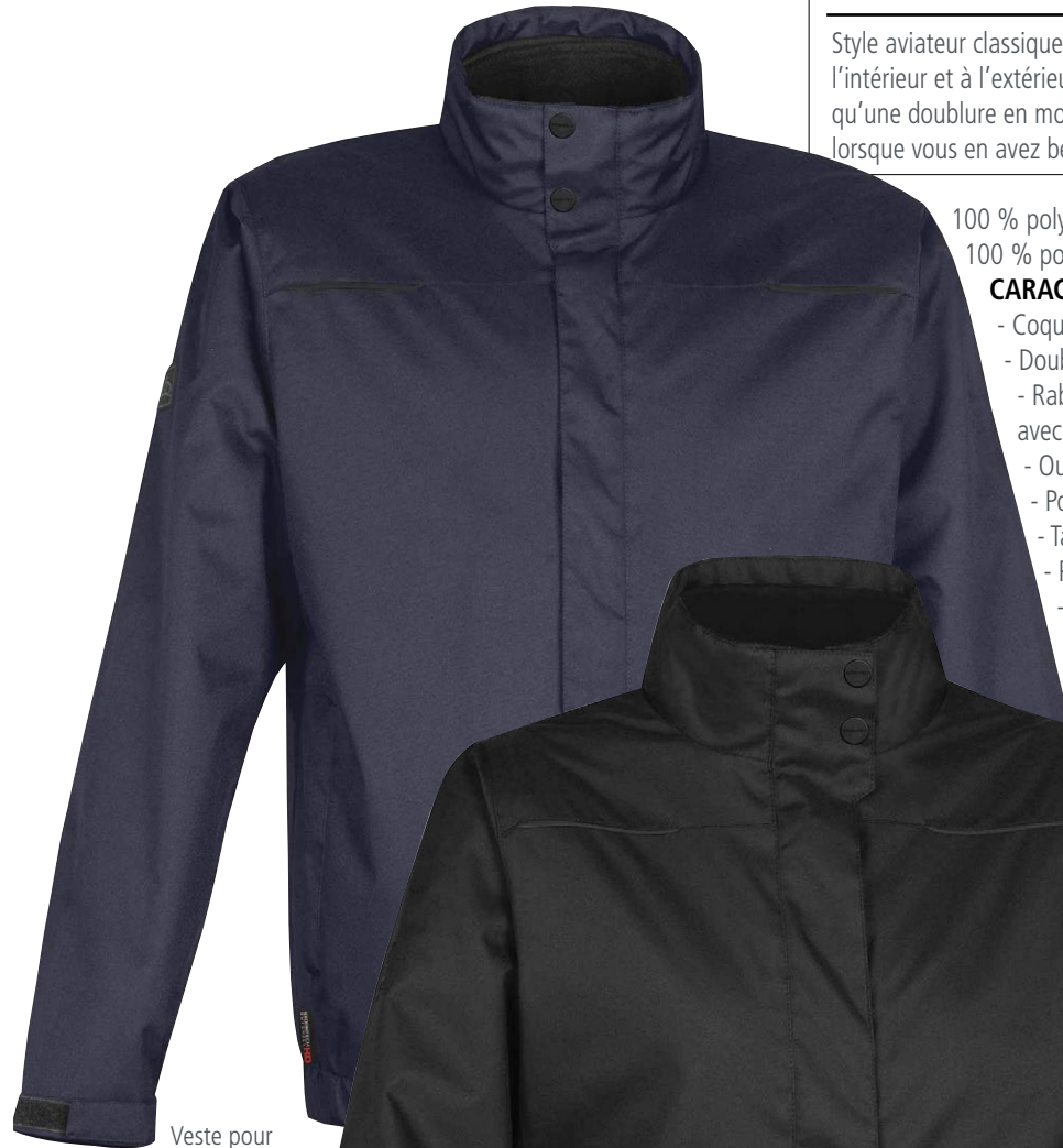
Veste pour hommes en marine