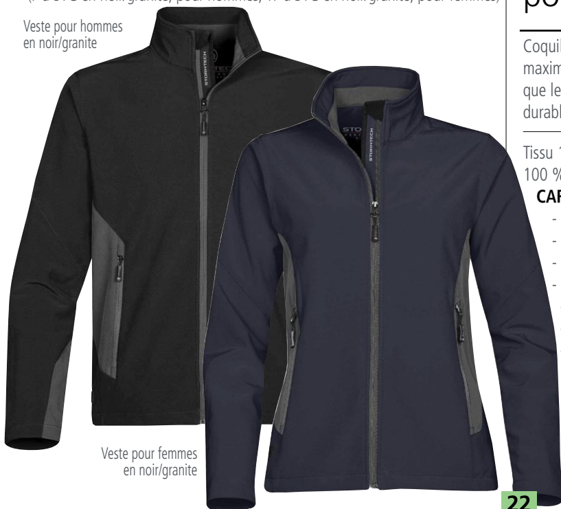
Veste pour femmes en noir/granite