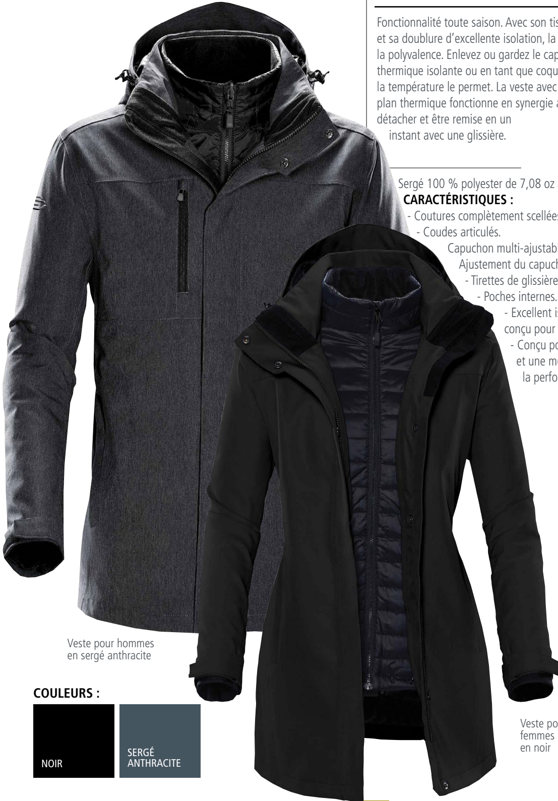
Veste pour hommes en sergé anthracite