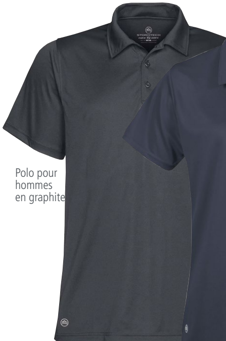
Polo pour hommes en graphite

(P à 3TG en noir, marine, pour hommes; TP à 3TG en noir, pour femmes)