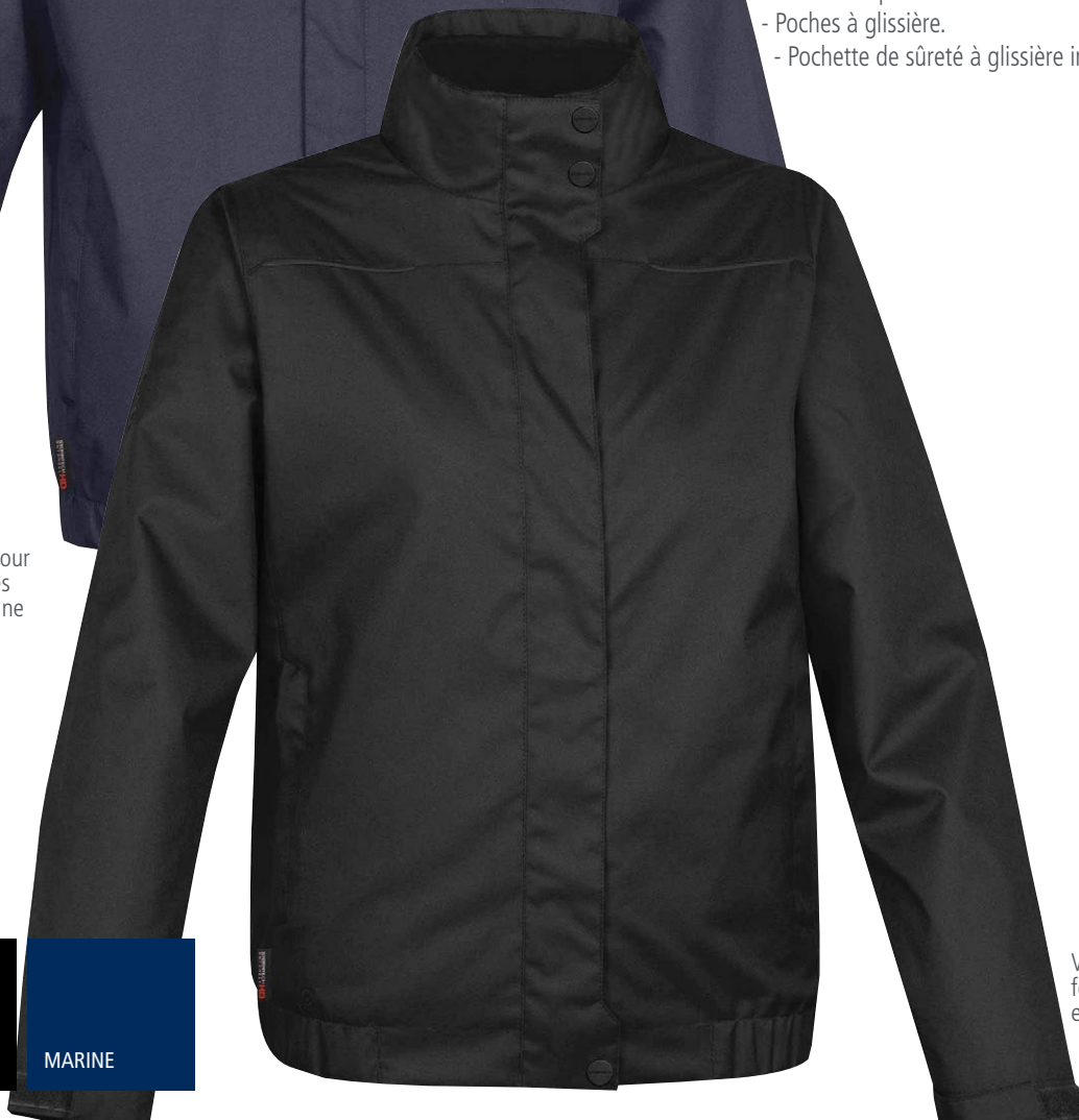
Veste pour femmes en noir