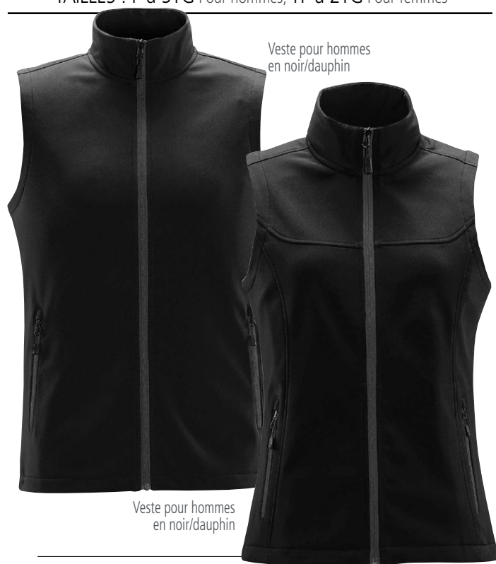
Veste pour hommes en noir/dauphin

TAILLES : P à 5TG Pour hommes, TP à 2TG Pour femmes